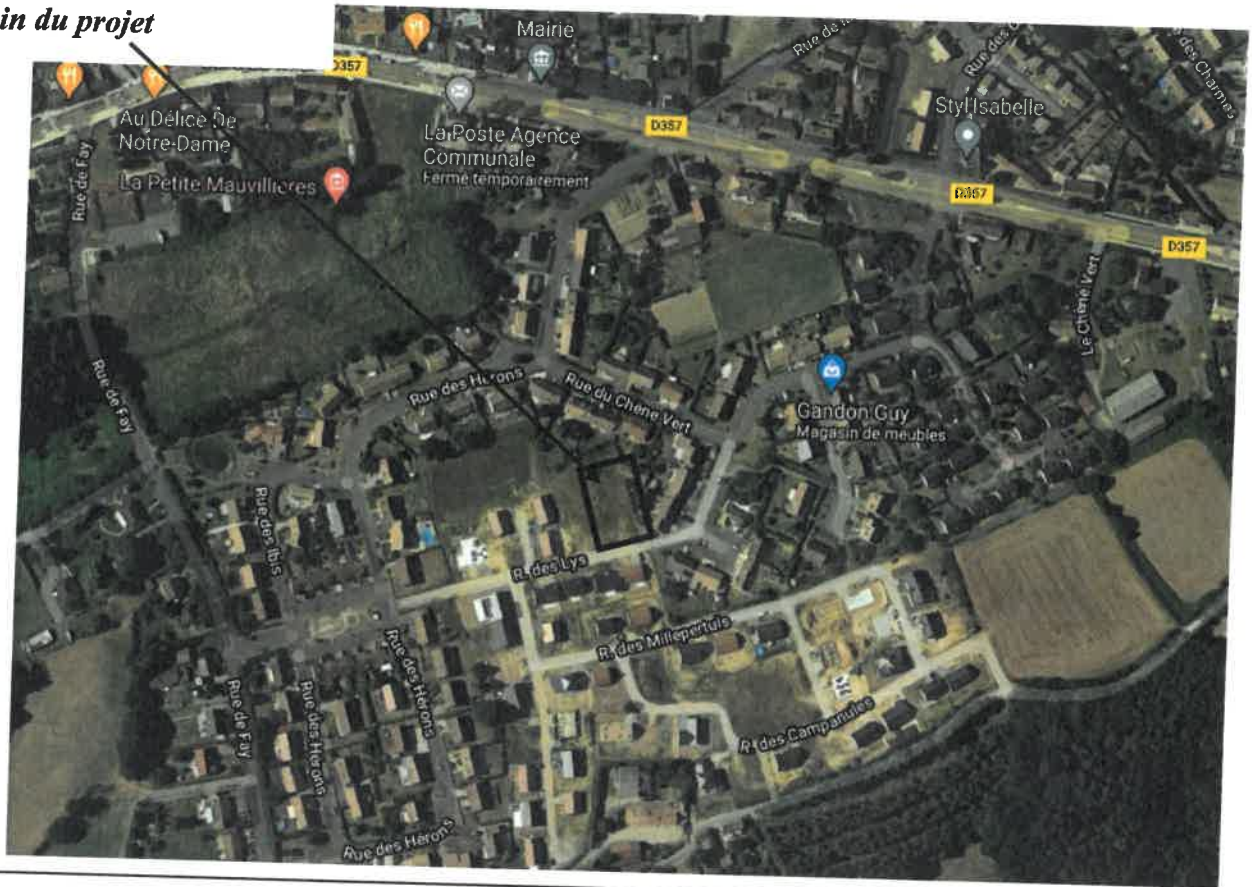
Terrain du projet